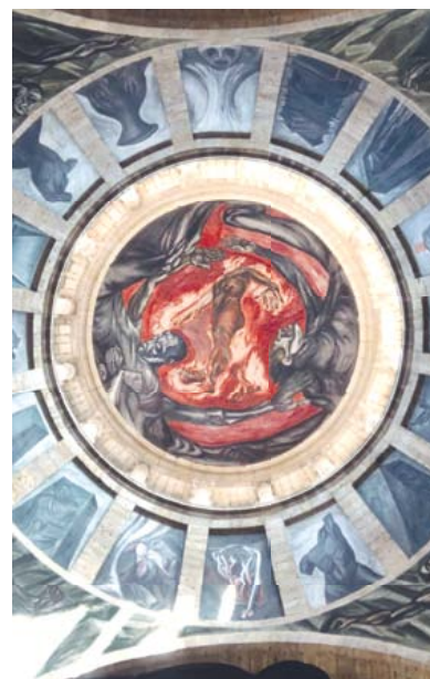
Hombre en llamas de José Clemente Orozco.