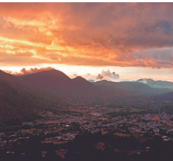
Amanecer desde El Zotolo.

Ideal para los viajeros atraídos por el ecoturismo y las actividades al aire libre, es un mágico lugar enclavado en la Sierra Norte de Puebla. Un municipio que recibe a sus invitados con una variada gastronomía y una oferta cultural, artesanal y hotelera para todos los gustos y presupuestos.