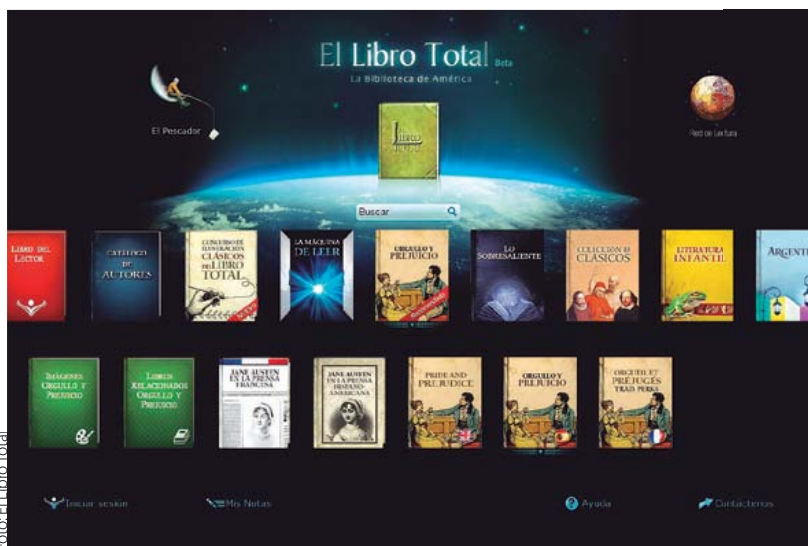
Foto: El libro total

Jorge Luis Borges, insigne lector, soñaba con un libro que lo contuviera todo, un volumen en el que se materializara el mundo de los vasos comunicantes, de historias paralelas y significados en apariencia independientes que se influyen, modifican y contaminan unas a otras hasta lo-