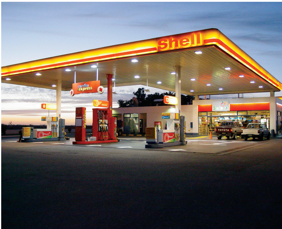
Energía I , de la serie Energía , 2006.

Igualmente, opina que la fotografía ha dado pasos agigantados en su descentralización, pues ya existen escuelas especializadas en Veracruz, Oaxaca o Guanajuato, por lo que ahora los jóvenes tienen más opciones para crear y explorar el mundo a través de una lente.