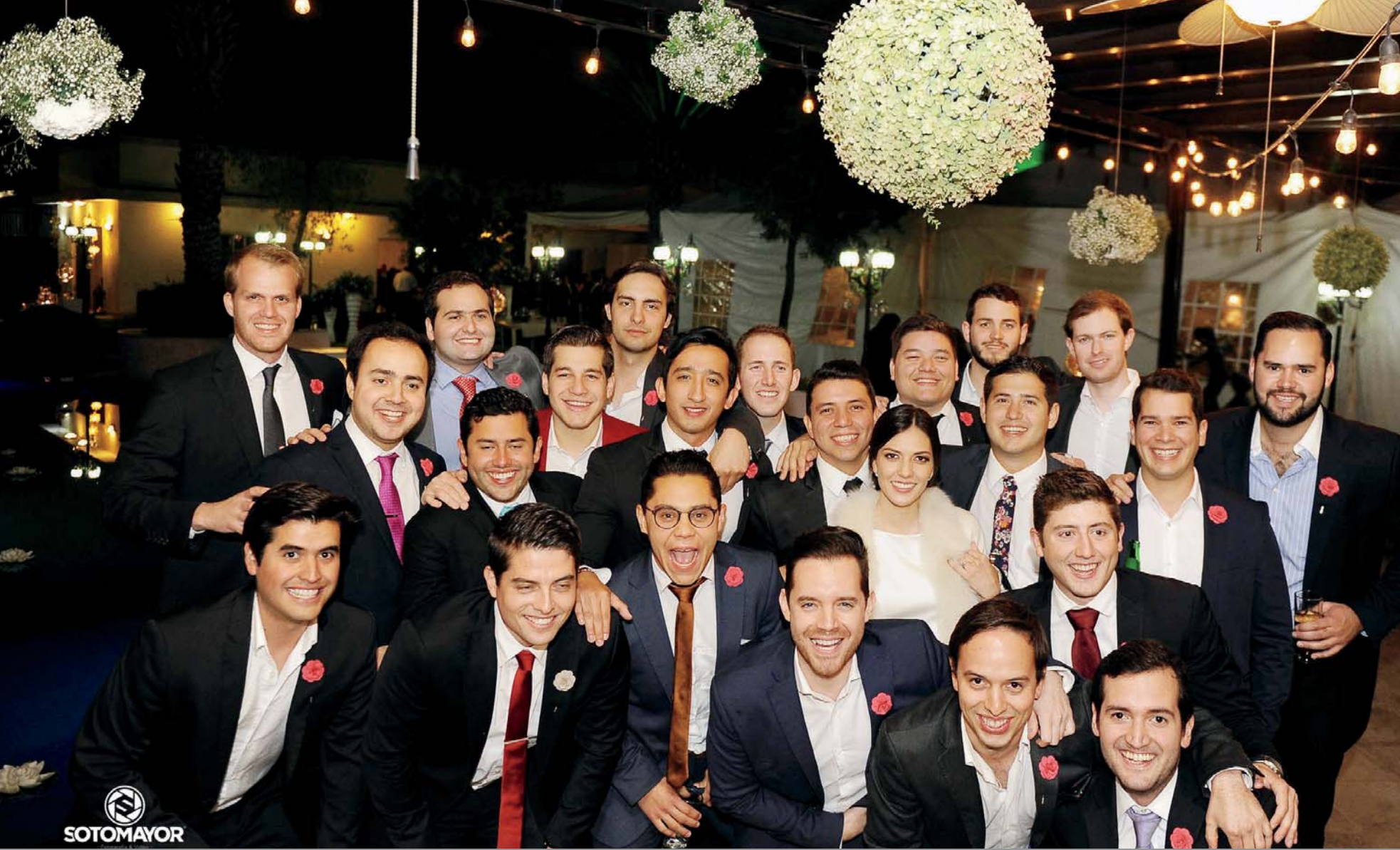
Acompañan a la feliz pareja.