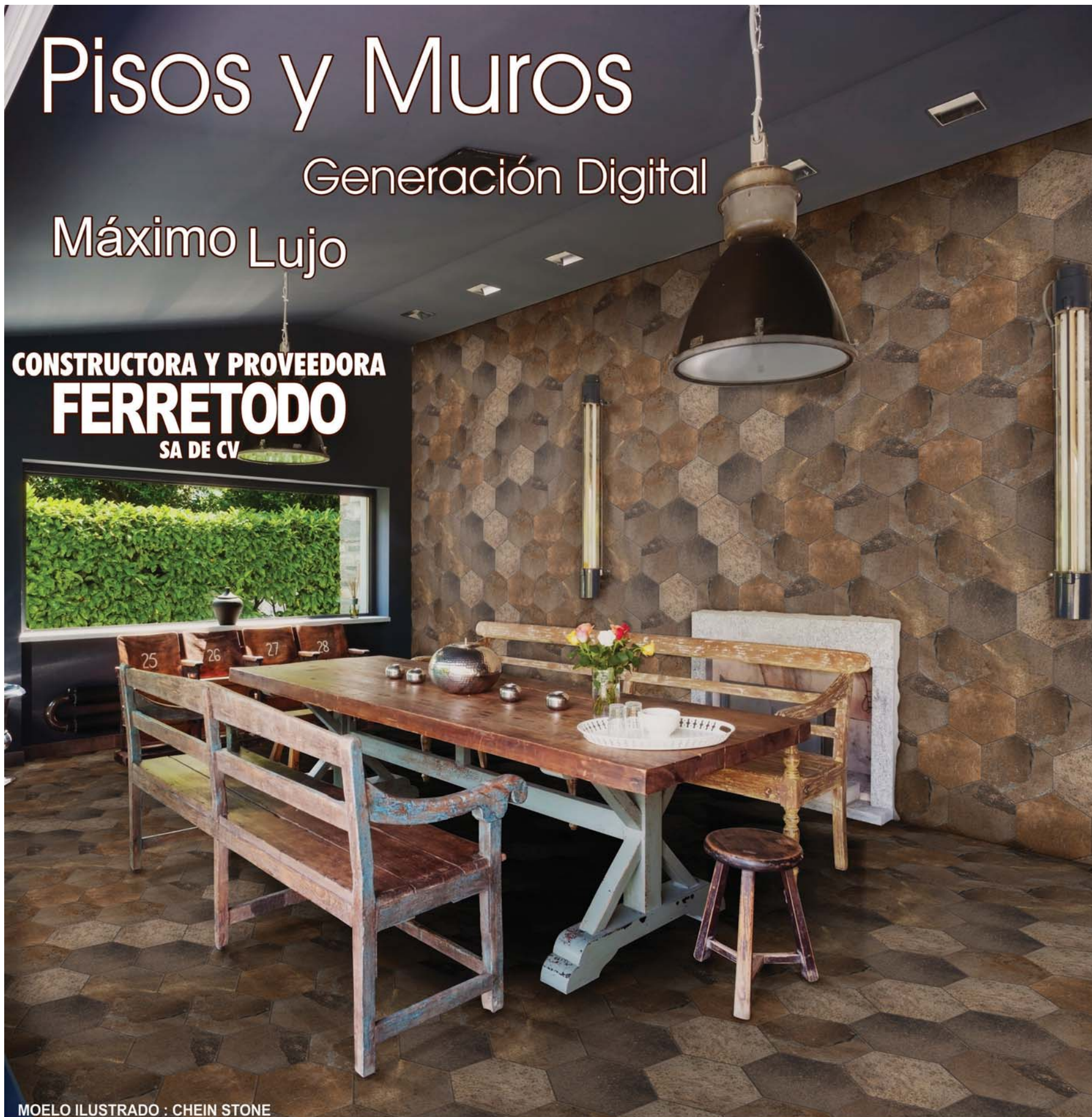
MOELO ILUSTRADO : CHEIN STONE

CONSTRUCTORA Y PROVEEDORA FERRETODO SA DE CV