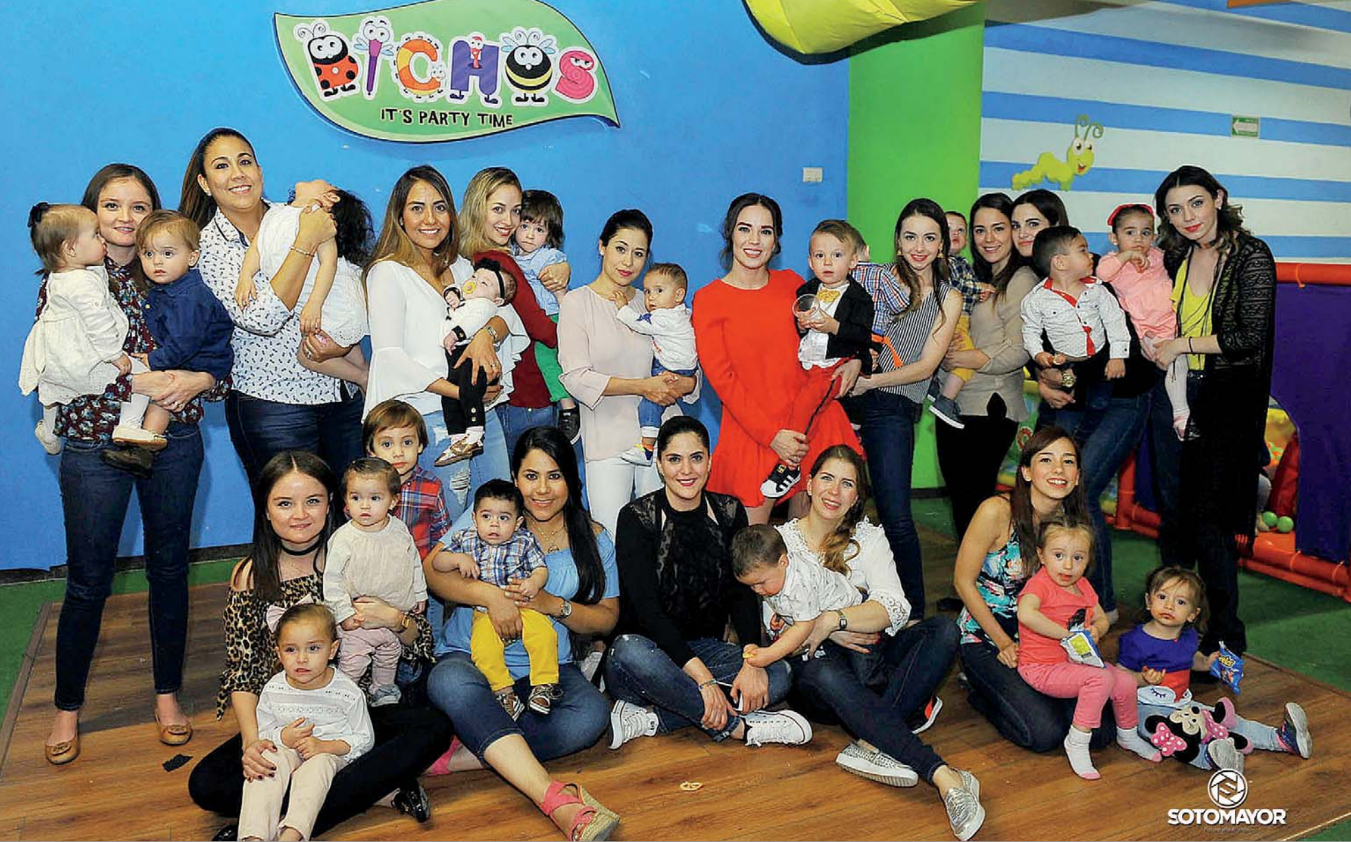
La foto del recuerdo.