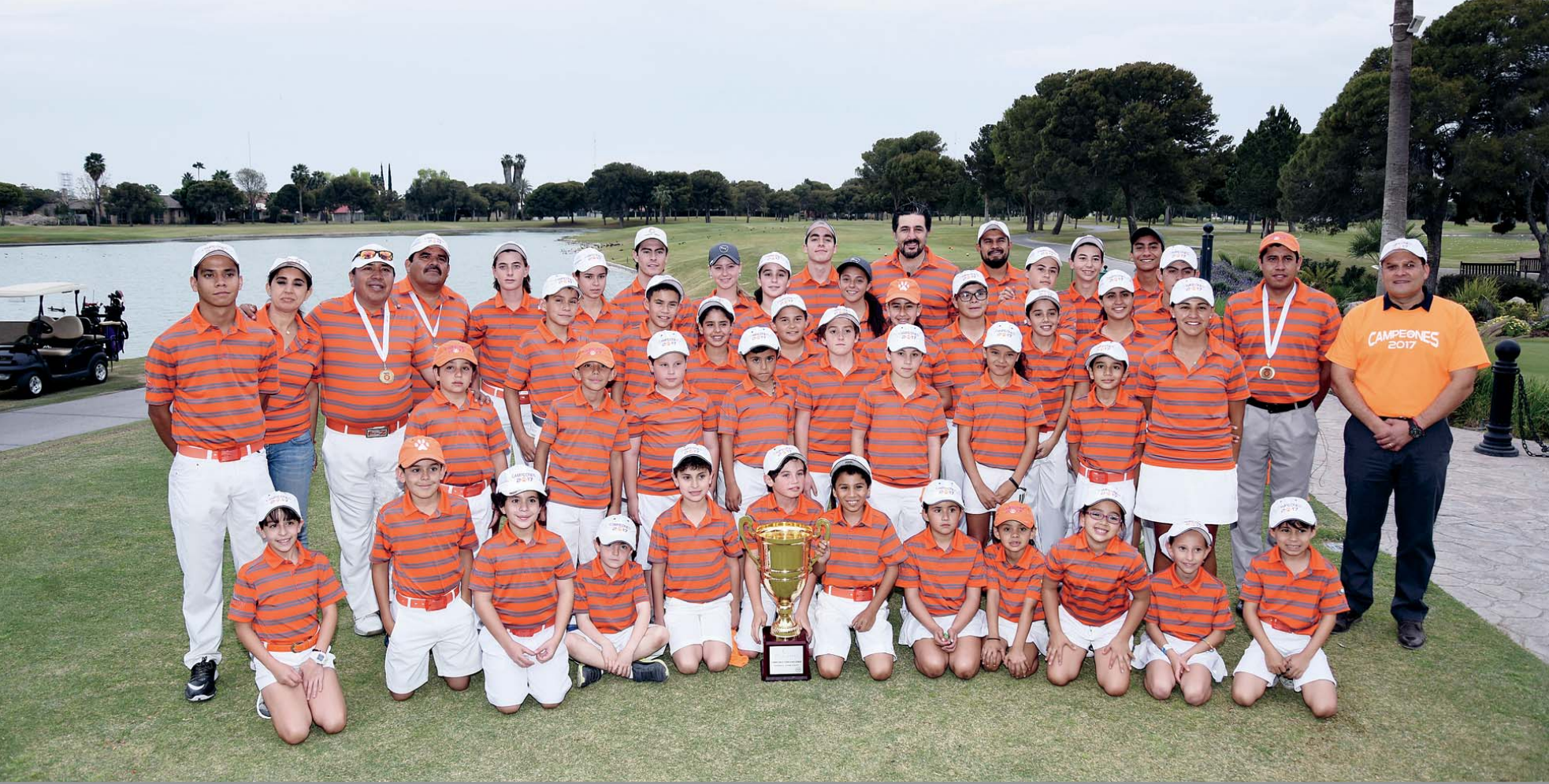
La foto del recuerdo.