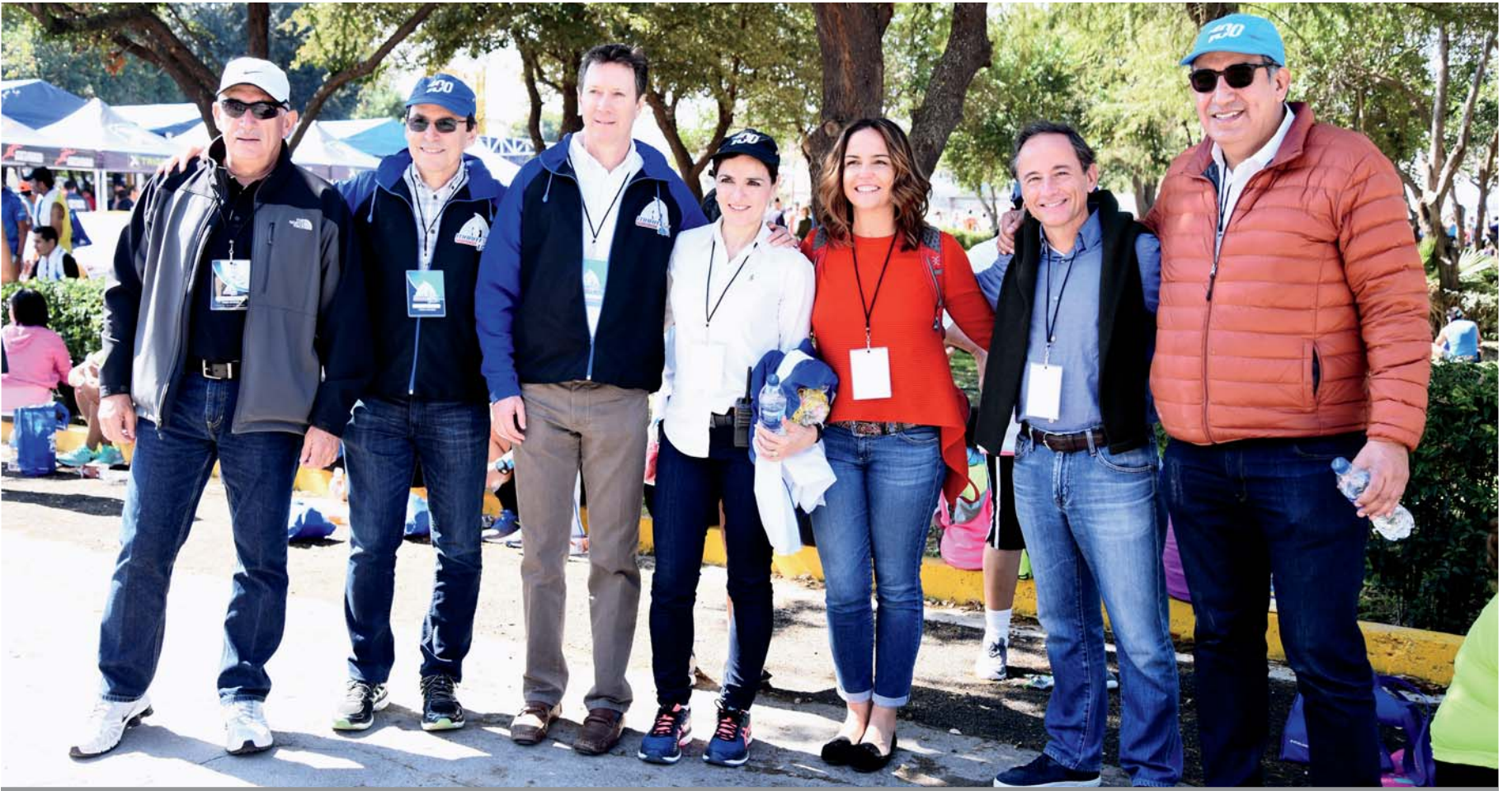
Consejo general y organizador del Maratón Lala.